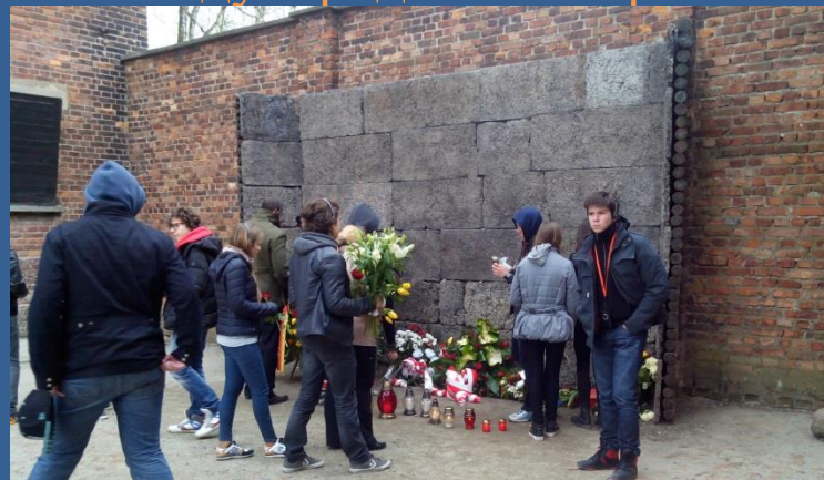
Проект «Цена Победы» Минск-Хатынь-Брест-Краков-Освенцим-Варшава